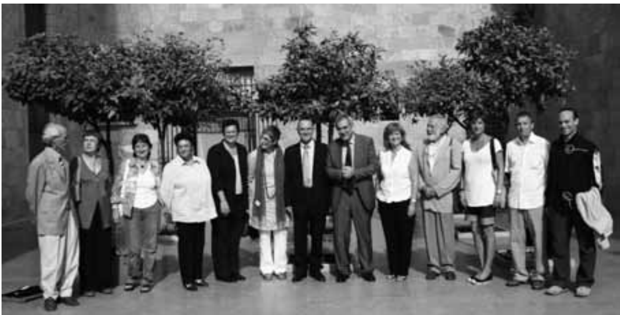
Imatge 1. Premis Catalunya d'Educació 2008

Llavors, què us podem oferir ja que en el seu moment vam adquirir el compromís de fer l'article? En primer lloc, i molt breument pels motius ja exposats, farem una presentació de la Xarxa 0-18. Després, us presentarem (com si d'una presentació en Power Point es tractés) algunes